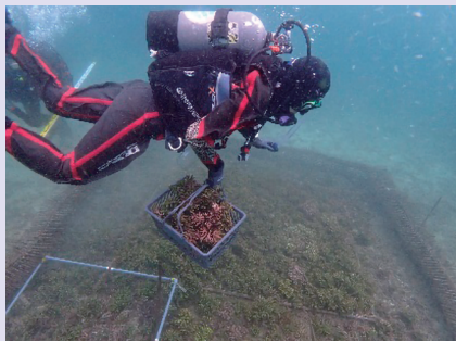
■種苗生産によって成長したサンゴの運搬