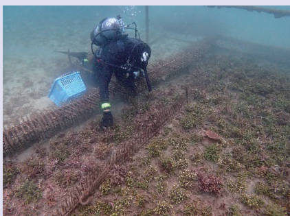
■種苗生産によって成長したサンゴの移植