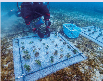
■養殖基盤へのサンゴ片の取り付け