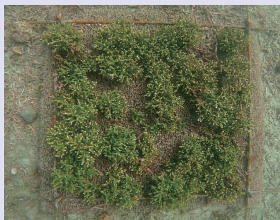
■養殖基盤上で大きく成長したサンゴ